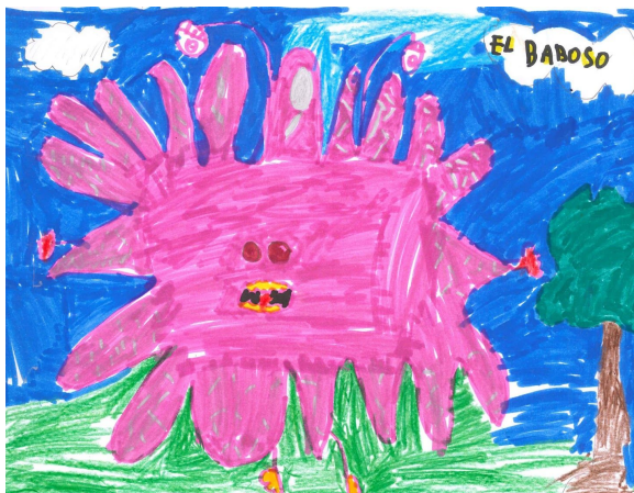
Enzo | Canelones, Uruguay