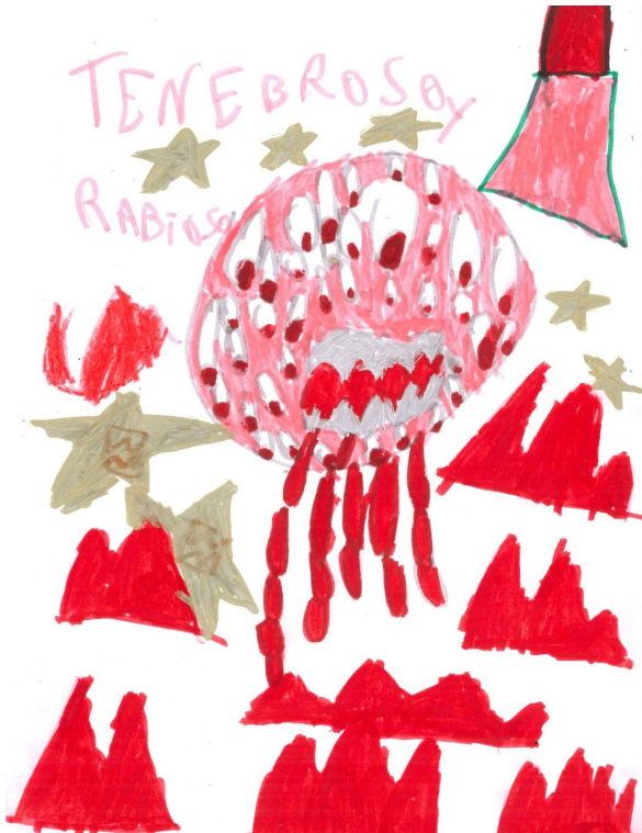
Melina | Canelones, Uruguay

Las siguientes imágenes forman parte del Proyecto The Monster Project Allies: Uruguay y sus autores figuran debajo de cada una. Es obligatorio referenciar el nombre de los autores y del proyecto original en caso de que se quieran utilizar para difundir o publicar.