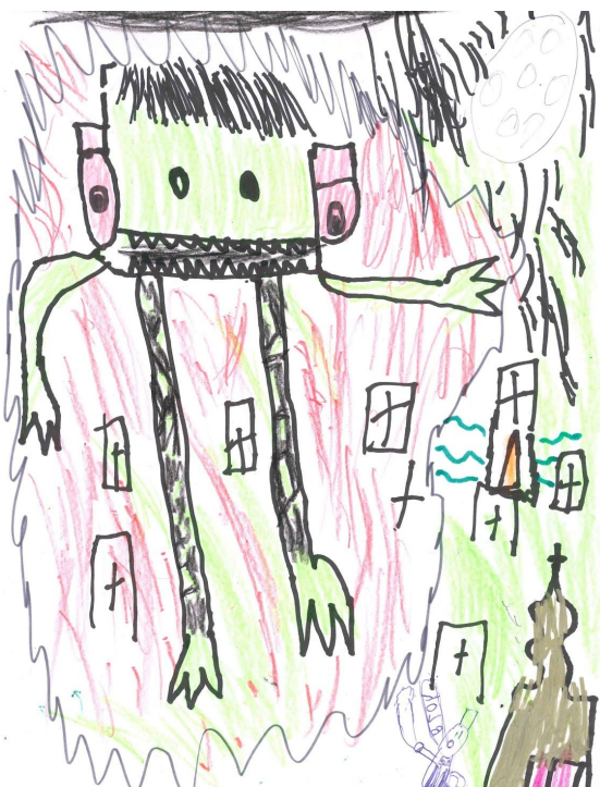
Lucas | Canelones, Uruguay